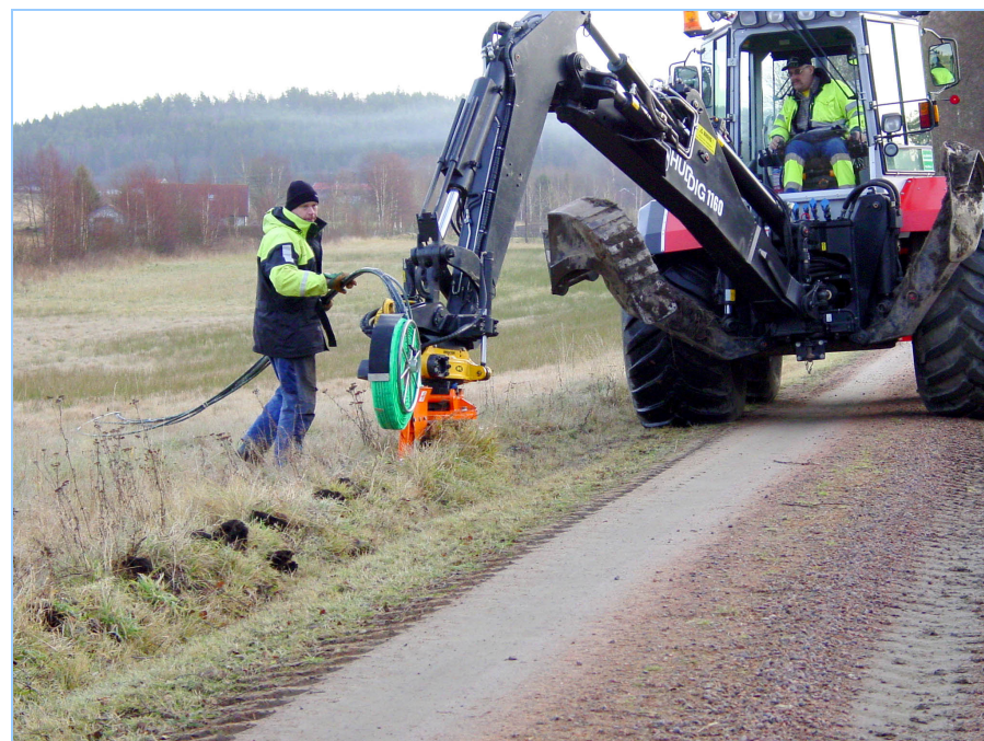
Grävningen påbörjades i Ringby den 6:e december

Medlemmarna i föreningen Kareby Bredband beslutade enhälligt vid en stämma den 3 november att fibernätet skall byggas.